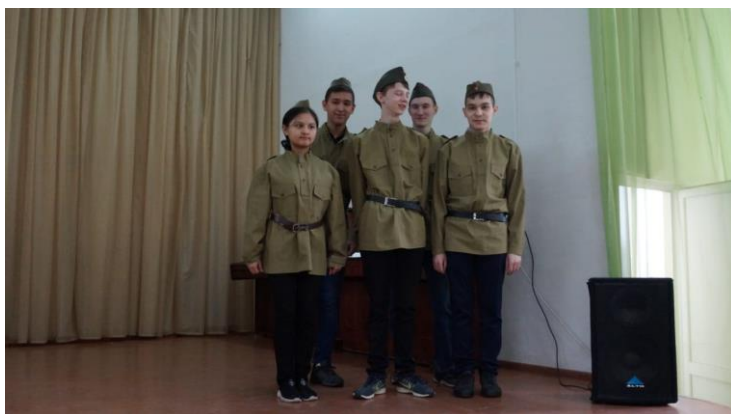
Акция «Ветеран живет рядом» «Георгиевская ленточка»